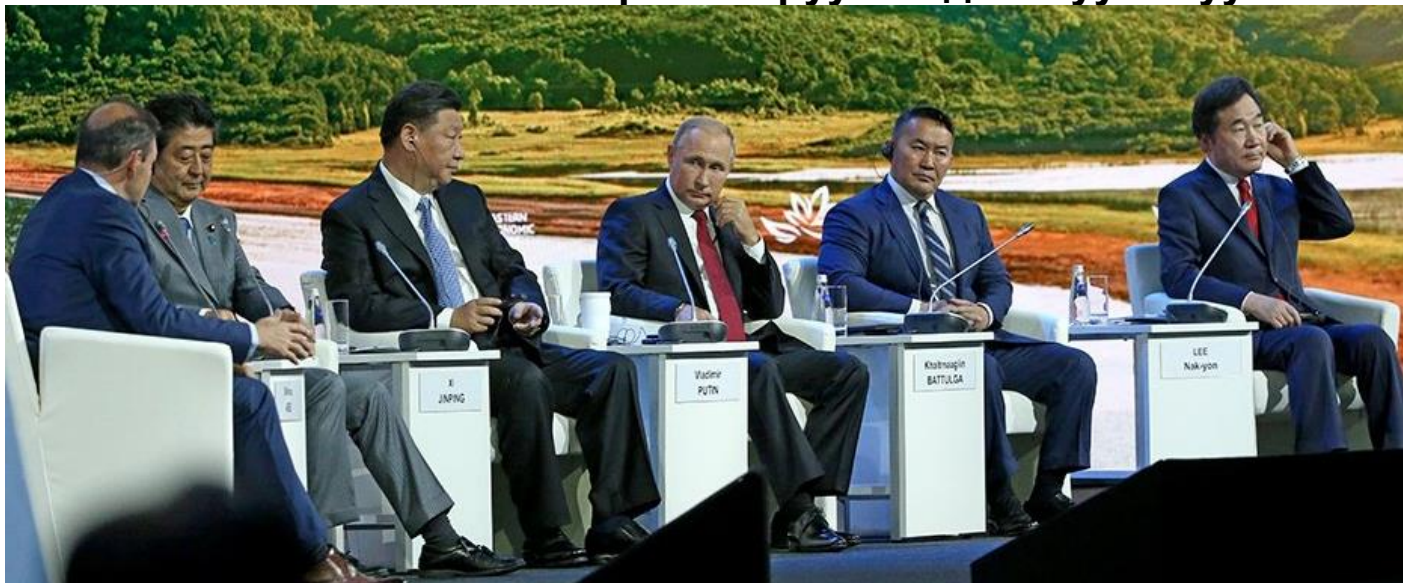
Монгол Улсын Ерөнхийлөгч Х.Баттулга, Япон Улсын Ерөнхий сайд Шинзо Абэ болон БНХАУ, ОХУ-ын төрийн тэргүүн, БНСУ-ын Ерөнхий сайд нарын хамт ОХУ-ын Владивосток хотод 2018 оны 9-р сард болсон Дорнын эдийн засгийн чуулганы үеэр.