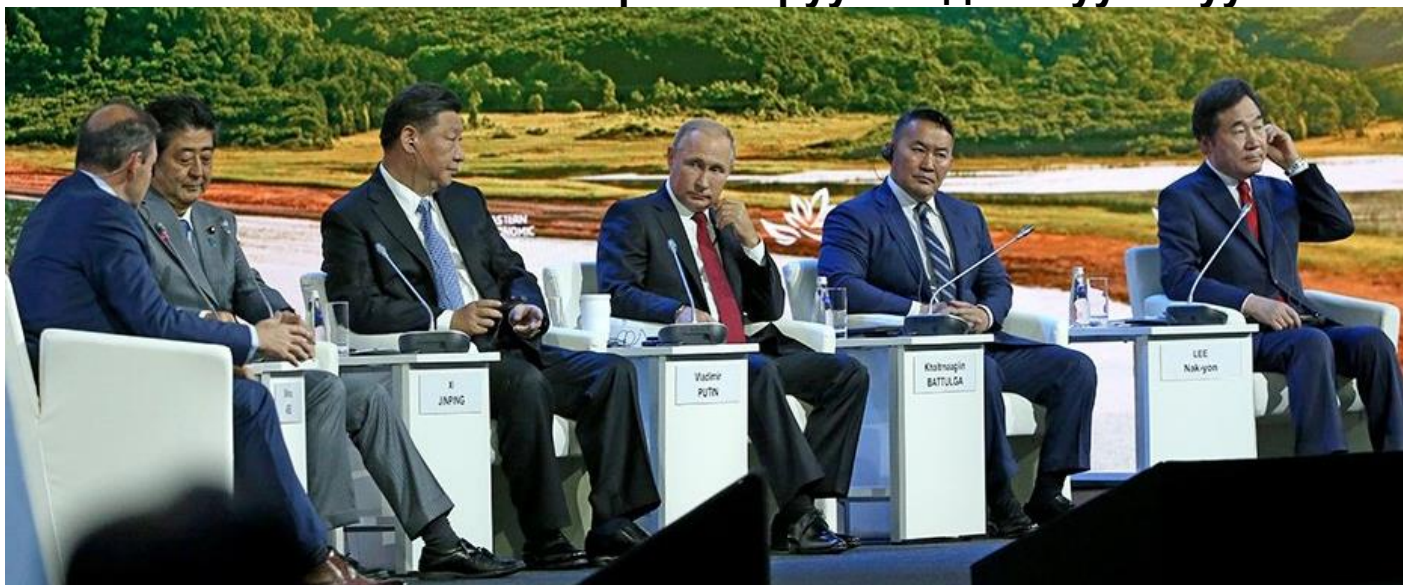
Монгол Улсын Ерөнхийлөгч Х.Баттулга, Япон Улсын Ерөнхий сайд Шинзо Абэ болон БНХАУ, ОХУ-ын төрийн тэргүүн, БНСУ-ын Ерөнхий сайд нарын хамт ОХУ-ын Владивосток хотод 2018 оны 9-р сард болсон Дорнын эдийн засгийн чуулганы үеэр.